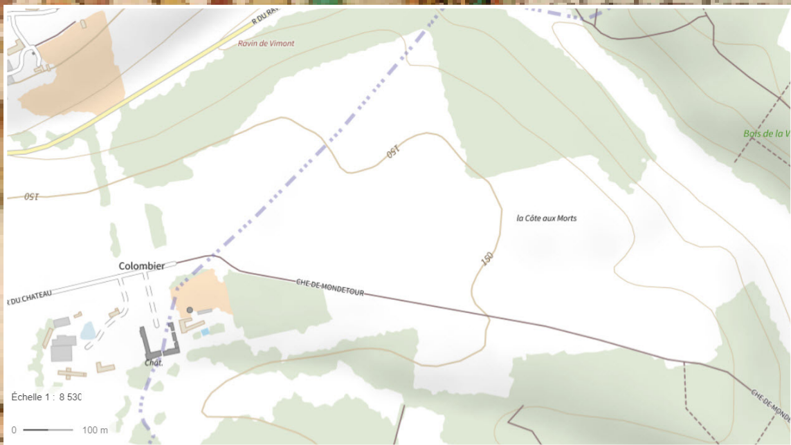
Carte d'état major et carte IGN ( sur Géoportail ) Sur fond d'écriture mérovingienne